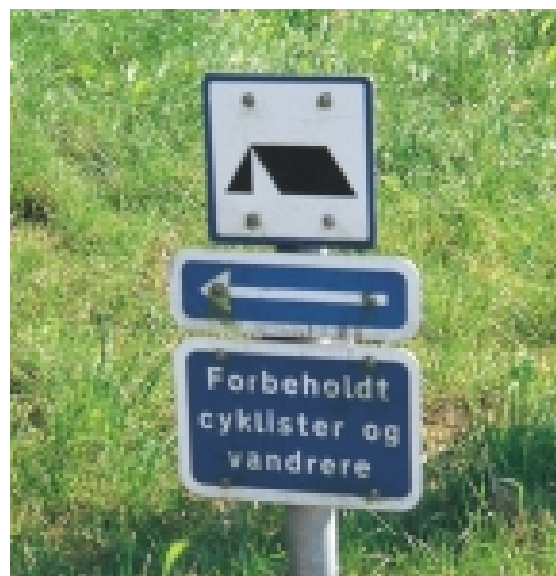
Teltplads til venstre.

Cykelkort for byområder er vigtige for beboere og tilflyttere, som ikke kender stisystemerne. Kortene skulle gerne vise vej, motivere til at cykle og give mulighed for bedre oplevelser. Kortene kan give ideer til afprøvning af forskellige ruter og kan benyttes på søndagscykelturen ud af byen. Kortene kan vise hvor aflåst/ overvåget/god cykel-parkering findes, så byturen ikke giver bekymringer for tyveri.