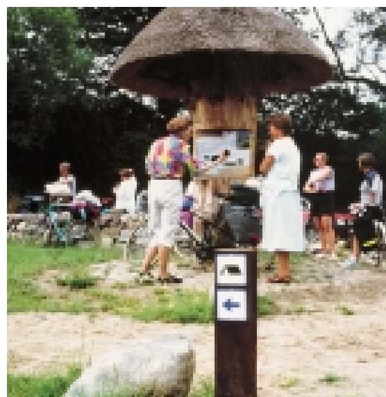
Kort bør være let tilgængeligt.

Endvidere påføres de vigtigste trafikmål for såvel lokale som turister. Signaturforklaring tilføjes gerne på dansk, engelsk og tysk, selvom kortene især henvender sig til lokale.