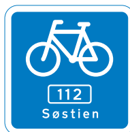
Rutetavler for nationale, regionale og lokale ruter.